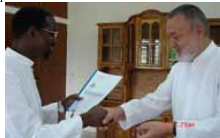
Le SG sortant passe le témoin au nouveau SG