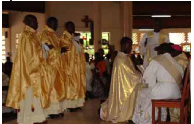
Rogation à genoux devant l'archevêque

La messe s'était déroulée dans une atmosphère d'allégresse totale, de paix et de sérénité. Elle a pris fin aux alentours de treize heures, après cinq heures d'horloge par la bénédiction finale du Père Evêque.