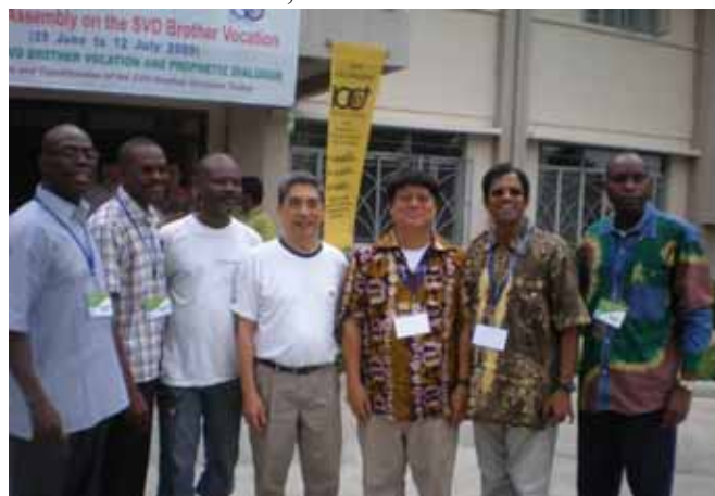
Les délégués de AFRAM Zone ensemble avec le Supérieur Général

Cette Assemblée qui a durée deux semaines, s'est déroulée dans une ambiance de fraternité et d'amitié. Elle a connu la participation effective de tous les participants. Elle a offert aussi l'occasion aux uns et aux autres de se revoir, de se connaître ou de tisser de