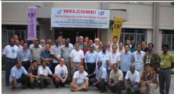
Photo de groupe de tous les participants

Du 29 juin au 12 juillet 2009 eu lieu à Cebu aux Philippines la deuxième Assemblée Générale des Frères. Cette Assemblée a regroupé une cinquantaine de confrères parmi lesquels le Supérieur Général lui-même, pour parler et discuter de la vocation des Frères.