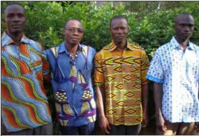
Les quatre nouveaux novices de la Province TOG

L'année académique vient de prendre fin au postulat SVD. Tandis que d'autres sont en vacances certains prennent la route pour le noviciat. En effet ils seront quatre à aller en juillet à Accra au Ghana où ils passeront quelques jours avant d'atterrir au noviciat. Là, ils passeront douze mois plein. Ce temps est appelé année canonique. Pendant ces douze mois, ils seront initiés à la vie communautaire, à la spiritualité de la congrégation et murir leur décision à la vie religieuse. Au terme de leur séjour au noviciat, chacun d'eux sera évalué et sera accepté ou non pour la profession des vœux selon les constitutions de la SVD. Ceux qui ne seront pas admis pour professer les vœux seront ré-orientés dans leur vie.