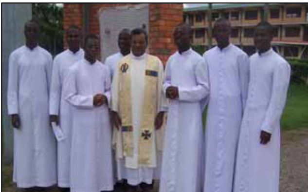
Les nouveaux profès de la province et le Provincial