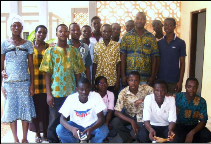
Photo du groupe vocationnel